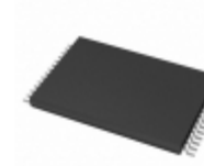
AT45D081-TI Microchip Technology IC FLASH 8MBIT 15MHZ 28TSOP