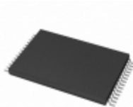
AT45D081-TC Microchip Technology IC FLASH 8MBIT 15MHZ 28TSOP