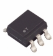
4N35S-TA Lite-On Inc. OPTOISO 3.55KV TRANS W/BASE 6SMD