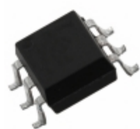
4N35S(TA)-V Everlight Electronics Co Ltd OPTOISO 5KV TRANS W/BASE 6SMD