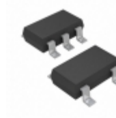
MIC5238-1.2YD5-TR Microchip Technology IC REG LDO 1.2V 0.15A TSOT23-5