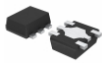
BU7465HFV-TR Rohm Semiconductor IC OPAMP GP 1.2MHZ RRO 5-HVSO8