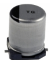
EEV-TG1A221P Panasonic Electronic Components CAP ALUM 220UF 20% 10V SMD