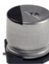
EEV-TA1H470P Panasonic Electronic Components CAP ALUM 47UF 20% 50V SMD