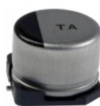
EEV-TA1V330P Panasonic Electronic Components CAP ALUM 33UF 20% 35V SMD