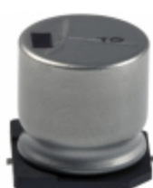
EEV-TG1A222M Panasonic Electronic Components CAP ALUM 2200UF 20% 10V SMD