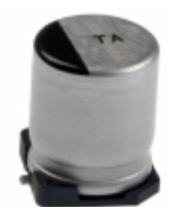
EEV-TA1H330P Panasonic Electronic Components CAP ALUM 33UF 20% 50V SMD