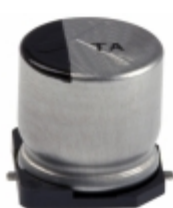
EEV-TA1V101P Panasonic Electronic Components CAP ALUM 100UF 20% 35V SMD