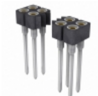
423-87-270-41-001101 Preci-Dip PCB CONN WIRE WRAP 2.54MM