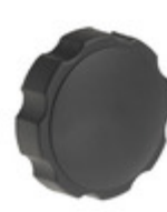
4230-A Davies Molding, LLC. KNOB FLUTED 5/16"-18 PLASTIC