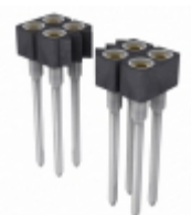
423-87-268-41-001101 Preci-Dip PCB CONN WIRE WRAP 2.54MM