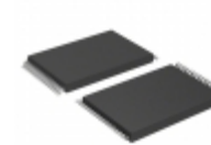
AT27BV010-15VC Microchip Technology IC OTP 1MBIT 150NS 32VSOP