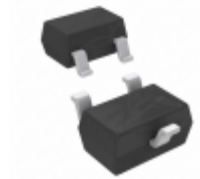
DDTA143XUA-7-F Diodes Incorporated TRANS PREBIAS PNP 200MW SOT323