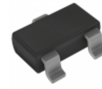
DDTA144ECA-7 Diodes Incorporated TRANS PREBIAS PNP 200MW SOT23-3