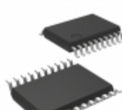
STM8S003F3P6TR STMicroelectronics IC MCU 8BIT 8KB FLASH 20TSSOP