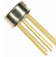
AD584KH Analog Devices Inc. IC VREF SERIES PROG TO99-8