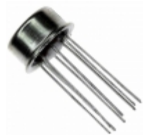
AD584JH Analog Devices Inc. IC VREF SERIES PROG TO99-8