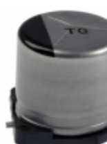
EEV-TG2A330P Panasonic Electronic Components CAP ALUM 33UF 20% 100V SMD