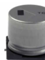
EEV-TG2A221M Panasonic Electronic Components CAP ALUM 220UF 20% 100V SMD