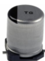
EEV-TG2A220UP Panasonic Electronic Components CAP ALUM 22UF 20% 100V SMD