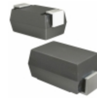
3SMAJ5916B-TP Micro Commercial Co DIODE ZENER 4.3V 3W DO214AC