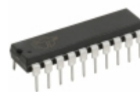
CY8C24223-24PI Cypress Semiconductor Corp IC MCU 8BIT 4KB FLASH 20DIP