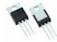
IXFP30N25X3 IXYS Corporation MOSFET N-CHANNEL 250V 30A TO220