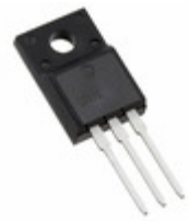
IXFP30N25X3M IXYS Corporation MOSFET N-CHANNEL 250V 30A TO220