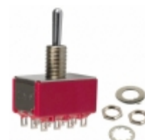
7401SCWCKE C&K SWITCH TOGGLE 4PDT 0.4VA 20V