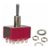
7401SCWCBE C&K SWITCH TOGGLE 4PDT 0.4VA 20V