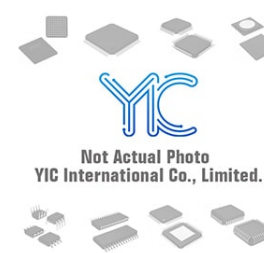
BM5951-11001 0 0 SSOP