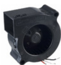
BM5125-04W-B59-L50 NMB Technologies Corp. FAN BLOWER 51X25MM 12VDC WIRE