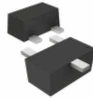
DSC9G02C0L Panasonic TRANS RF NPN 20V 15MA SSMINI3