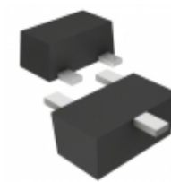
DSC9A01T0L Panasonic TRANS NPN 40V 0.05A SSMINI3