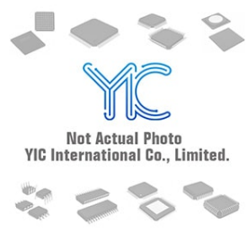
CLA53104BA N/A CLA53104BA N/A