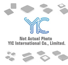
CLA71028CW GPS GPS PLCC44