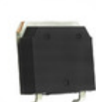
CLA50E1200TC IXYS THYRISTOR PHASE 1200V TO-268