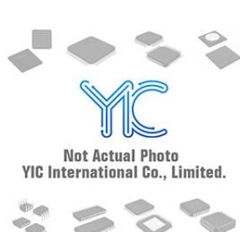
AD7171BCPZ ADI AD7171BCPZ ADI