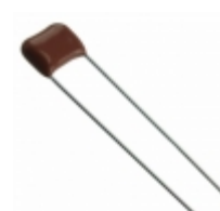
ECQ-E2123JF Panasonic Electronic Components CAP FILM 0.012UF 5% 250VDC RAD