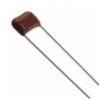
ECQ-E2123JF9 Panasonic Electronic Components CAP FILM 0.012UF 5% 250VDC RAD