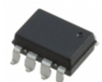
ASSR-3220-502E Broadcom Limited RELAY GP DPST 0.2A 250V 8-SMD