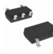
MIC5365-1.2YC5-TR Microchip Technology IC REG LDO 1.2V 0.15A SC70-5