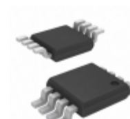
MIC5206YMM-TR Microchip Technology IC REG LDO ADJ 0.15A 8MSOP