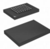
CY7C1021CV33-12BAXIT Cypress Semiconductor Corp IC SRAM 1MBIT 12NS 48FBGA