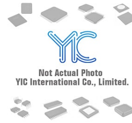
DTCA144TM ROHM ROHM SOT-723