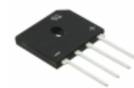
GBU4J-E3/51 Electro-Films (EFI) / Vishay DIODE GPP 1PH 4A 600V GPP GBU