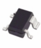
ADCMP356YKS-REEL7 Analog Devices Inc. IC COMP/REF PP ACTIVE HI SC70-4