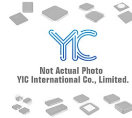
ADCMP370AKSZ AD ADCMP370AKSZ AD