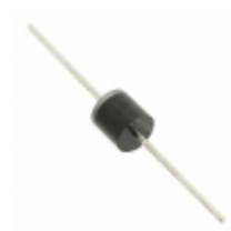
5KP7.0CA-G Comchip Technology TVS DIODE 7VWM 12VC R6