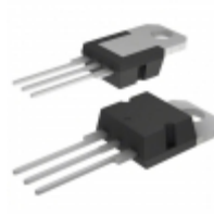
MIC29310-5.0WT Microchip Technology IC REG LDO 5V 3A TO220-3