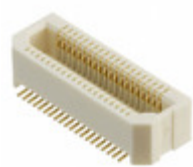
AXK5S40247YG Panasonic Electric Works CONN SOCKET BRD/BRD .5MM 40POS