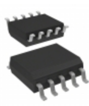
VIPER06XSTR STMicroelectronics IC OFFLINE SWITCH PWM 10- SSOP