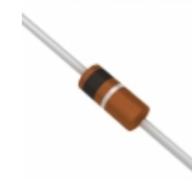
BZX55B2V4-TR Electro-Films (EFI) / Vishay DIODE ZENER 2.4V 500MW DO35