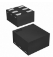
NC7SZ57FHX Fairchild/ON Semiconductor IC GATE UHS UNIV 2INP 6MICROPAK2