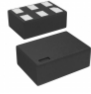
NC7SZ57L6X Fairchild/ON Semiconductor IC LOGIC GATE UHS 2-INP 6-MICROPAK