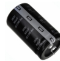
EET-HC2V681KA Panasonic Electronic Components CAP ALUM 680UF 20% 350V SNAP