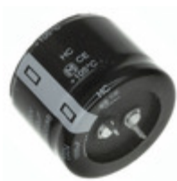
EET-HC2V821LA Panasonic Electronic Components CAP ALUM 820UF 20% 350V SNAP