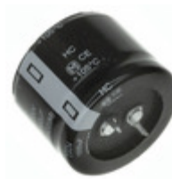
EET-HC2V681EA Panasonic Electronic Components CAP ALUM 680UF 20% 350V SNAP