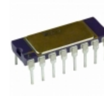
AD524AD Analog Devices Inc. IC OPAMP INSTR 1MHZ 16CDIP