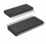
ADG3247BRU Analog Devices Inc. IC SW BUS 2.5/3.3V 16BIT 38TSSOP