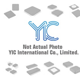
BD45295G-CT ROHM ROHM SOT23-5