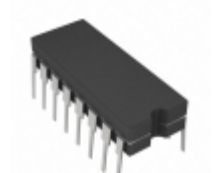
MX7520TQ/883B Maxim Integrated IC DAC COTS