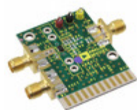
AD8317-EVALZ Analog Devices Inc. EVAL BOARD CONTROL LOG DETECTOR