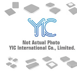
AD8318SCPZ-EP ADI AD8318SCPZ-EP ADI