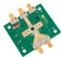
AD8318-EP-EVALZ Analog Devices Inc. EVAL BOARD FOR AD8318