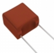
ECW-F2685JA Panasonic Electronic Components CAP FILM 6.8UF 5% 250VDC RADIAL