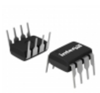
X9C503PIZ Intersil IC XDCP 100-TAP 50K EE 8-DIP