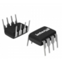
X9C503P Intersil IC DIGITAL POT 50K 100TP 8DIP