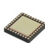
PIC32MX230F064C-V/TL Microchip Technology IC MCU 32BIT 64KB FLASH 36VTLA