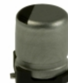
ECE-V0JA101SP Panasonic Electronic Components CAP ALUM 100UF 20% 6.3V SMD