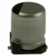
ECE-V0GA221SP Panasonic Electronic Components CAP ALUM 220UF 20% 4V SMD