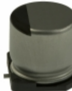
ECE-V0JA102P Panasonic Electronic Components CAP ALUM 1000UF 20% 6.3V SMD