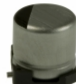
ECE-V0GA101SR Panasonic Electronic Components CAP ALUM 100UF 20% 4V SMD