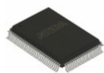
EPC16QC100N Altera IC CONFIG DEVICE 16MBIT 100QFP