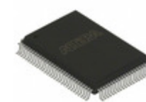
EPC16QI100N Altera IC CONFIG DEVICE 16MBIT 100QFP