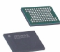
EPC16UC88AA Altera IC CONFIG DEVICE 16MBIT 88UBGA