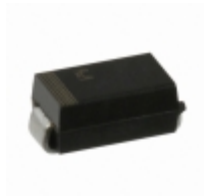
ATV04A360J-HF Comchip Technology TVS DIODE 36VWM 58.1VC SMA