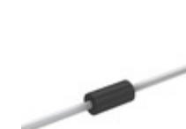
P4KE300A Littelfuse Inc. TVS DIODE 256VWM 414VC AXIAL