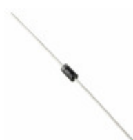
P4KE300-G Comchip Technology TVS DIODE 243VWM 430VC DO41