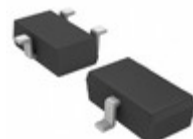
2SCR512RTL Rohm Semiconductor TRANS NPN 30V 2A TSMT3