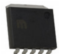
MIC37301-1.65BR TR Microchip Technology IC REG LDO 1.65V 3A SPAK-5