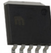
MIC37301-1.8WR-TR Microchip Technology IC REG LDO 1.8V 3A SPAK-5