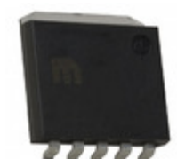
MIC37301-1.8WR Microchip Technology IC REG LDO 1.8V 3A SPAK-5