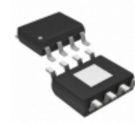
MIC37301-1.5YME Microchip Technology IC REG LDO 1.5V 3A 8SOIC