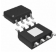
MIC37301-1.8YME Microchip Technology IC REG LDO 1.8V 3A 8SOIC