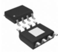
MIC37301-1.5YME-TR Microchip Technology IC REG LDO 1.5V 3A 8SOIC