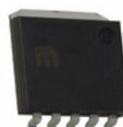
MIC37301-1.65BR Microchip Technology IC REG LDO 1.65V 3A SPAK-5