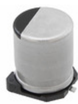
EEE-FT1E471GP Panasonic Electronic Components CAP ALUM 470UF 20% 25V SMD