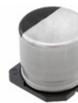
EEE-FT1E821AP Panasonic Electronic Components CAP ALUM 820UF 20% 25V SMD