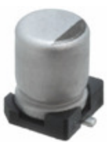
EEE-FT1H220AR Panasonic Electronic Components CAP ALUM 22UF 20% 50V SMD