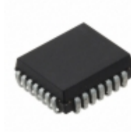
ST16C1551IJ28-F Exar Corporation IC UART FIFO 16B 28PLCC